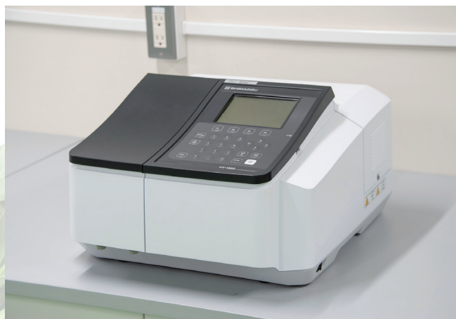
図2 紫外可視分光光度計

2026年4月1日以降開始の依頼試験項目です。 料金は、決定次第、掲載いたします。